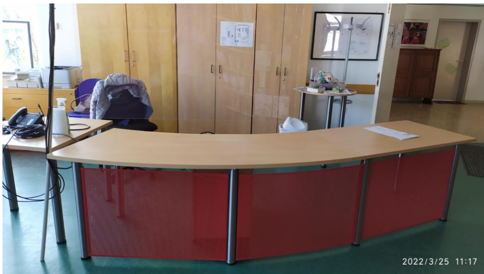
Abbildung 02: Ansicht der Theke nach der Erweiterung vor dem Aufbau der EDV