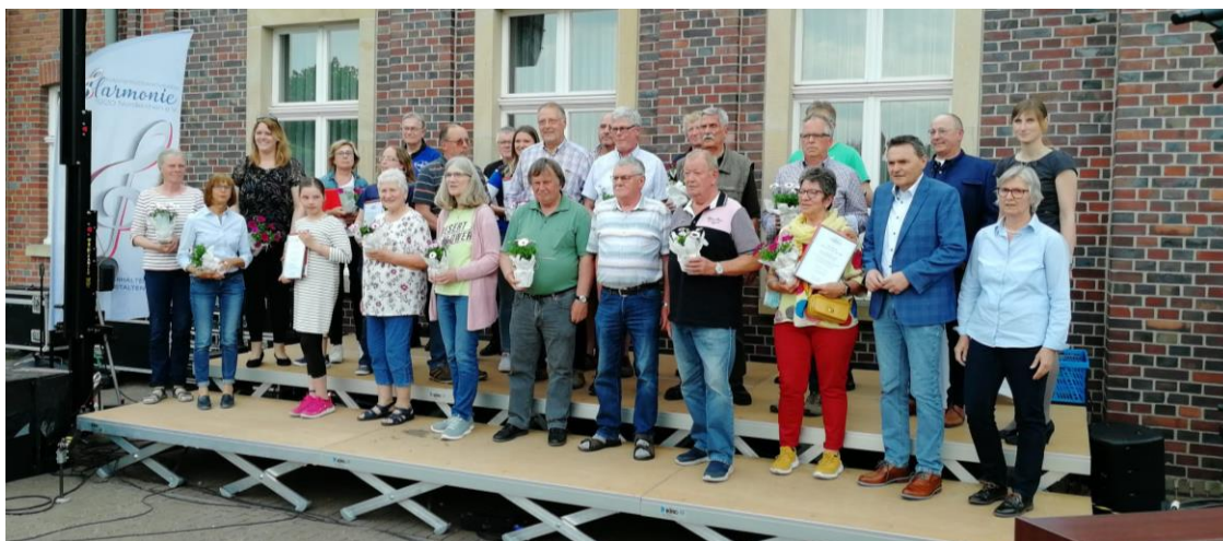
Abbildung 05: Alle Preisträger auf der Bühne