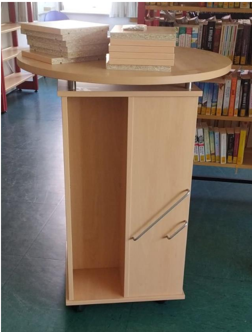
Abbildung 01: Bücherkubus mit Top-Platte unmittelbar nach der Lieferung

Beide Möbel wurden am 25.03.2022 durch die Fa. Clemens Portmann Bibliothekseinrichtungen e.K. geliefert und aufgebaut.