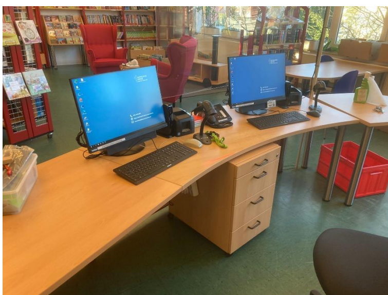
Abbildung 03: Ansicht der Theke nach der Erweiterung nach dem Aufbau der EDV