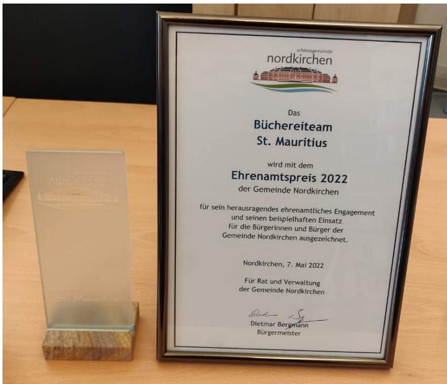
Abbildung 06: Den Preis haben wir in der Bücherei ausgestellt