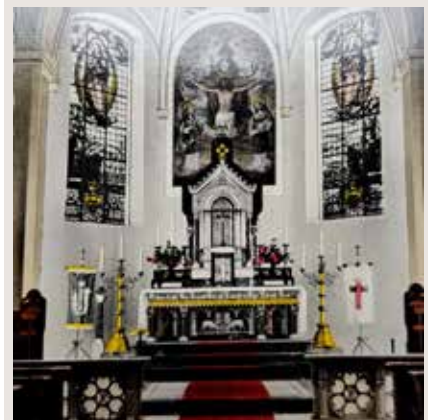
Historische Ansicht des Altarraums.

Für den medialen Transport sind Führungen, Stationen, Rundgänge – ja sogar eine Licht- und Videoprojektion geplant. (JT)